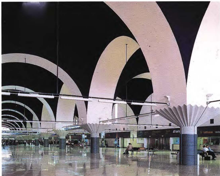
Aeropuerto de San Pablo.

La aplicación exhaustiva de las posibilidades contenidas en la Ley del Suelo y, más recientemente, en la Ley de Reforma del Régimen Urbanístico, así como el Patrimonio Municipal de Suelo previo, ha posibilitado que la GMU participe como socio patrimonial en la práctica totalidad de estas actuaciones, captando para la ciudad una parte de las plusvalías generadas por la propia transformación urbana, lo que ha permitido afrontar el coste de la aportación de terrenos a la construcción de los sistemas generales sin casi contribución de las arcas municipales.