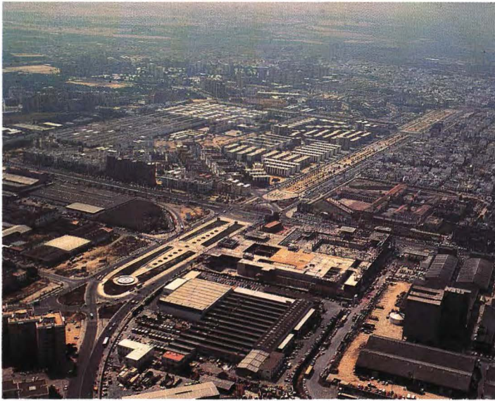
Ronda del Tamarguillo.