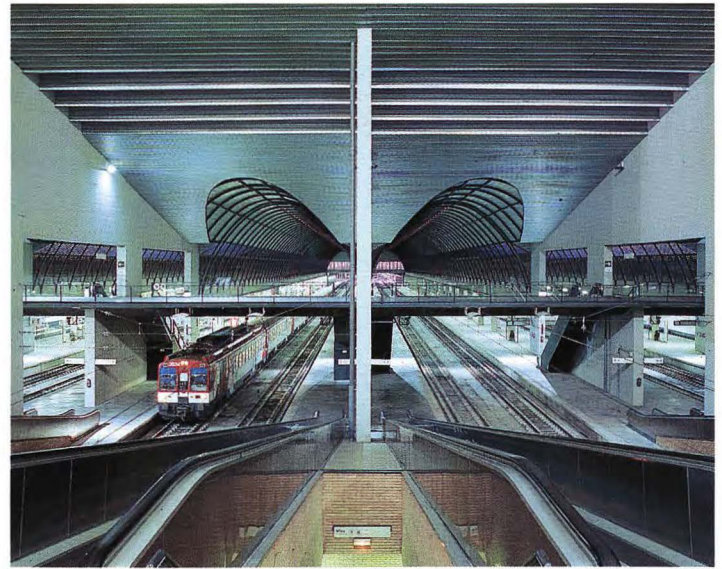
Estación de Santa Justa.