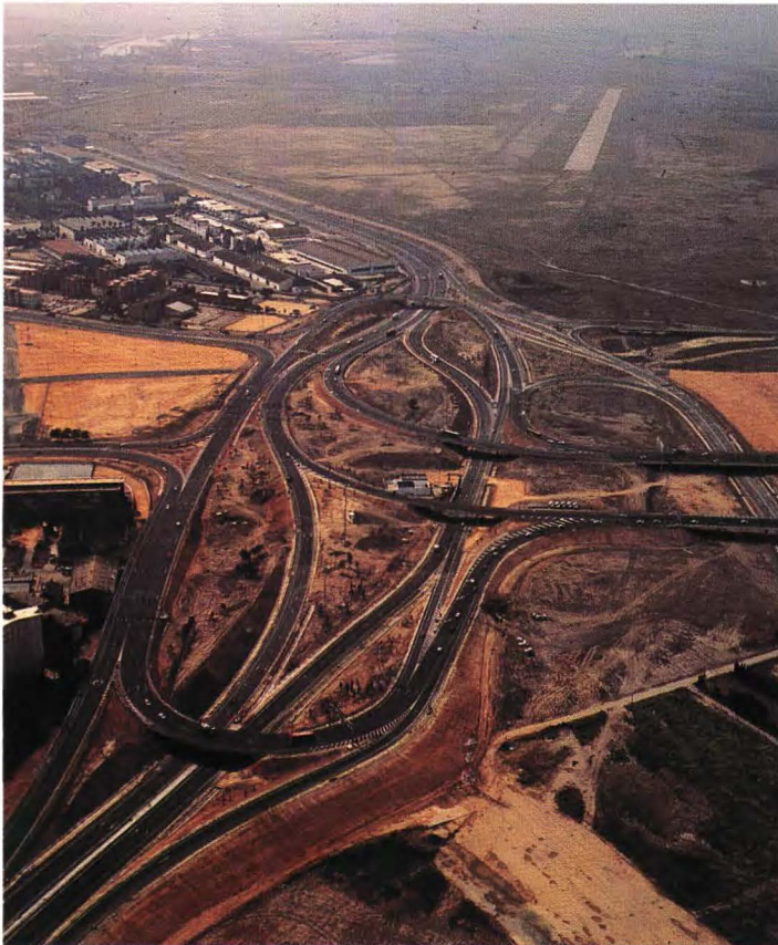
Ronda de Circunvalación, SE-30.